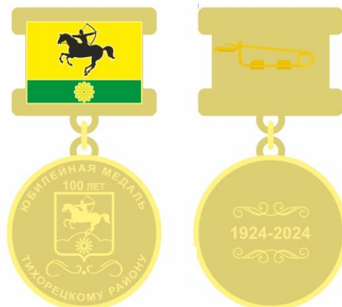
РИСУНОК юбилейной медали, посвященной 100-летию образования Тихорецкого района

С обратной стороны колодка оснащена креплением «безопасная булавка».